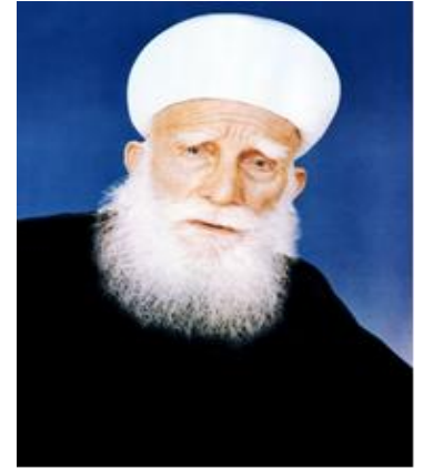
שיח' אמין טריף ז"ל