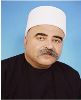
שיח' מופק טריף

השיח' אמין טריף ז"ל ( שנות כהונה 1928-1993 ) היה למנהיג הרוחני הדתי של העדה הדרוזית בישראל ובמזרח התיכון בכלל . דאג לענייני העדה הדרוזית מול המנדט הבריטי והצליח לשמור על מעמדה המיוחד והניטרלי של העדה בימי המרד הערבי 1936-1939 וכן באירועים להכרזת העצמאות ובמלחמת העצמאות ולאחר מכן חיזק וקידם את הקשר מול השלטונות במדינת ישראל ובשנת 1956 הביא להכרת מדינת ישראל בעדה הדרוזית כעדה דתית עצמאית והחל משנת 1962 קבלת עצמאות שיפוטית בבתי הדין הדרוזיים והיה לנשיא בית הדין הדרוזי הראשון ולאורך כל שנות כהונתו דאג לייסד, לבנות ולפתח את המקומות הקדושים לעדה .